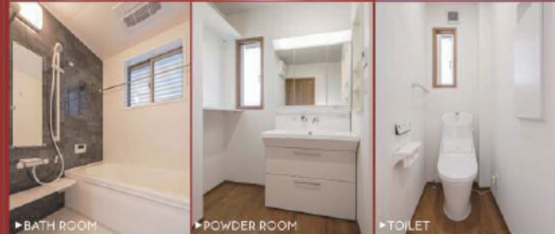
▶ BATH ROOM