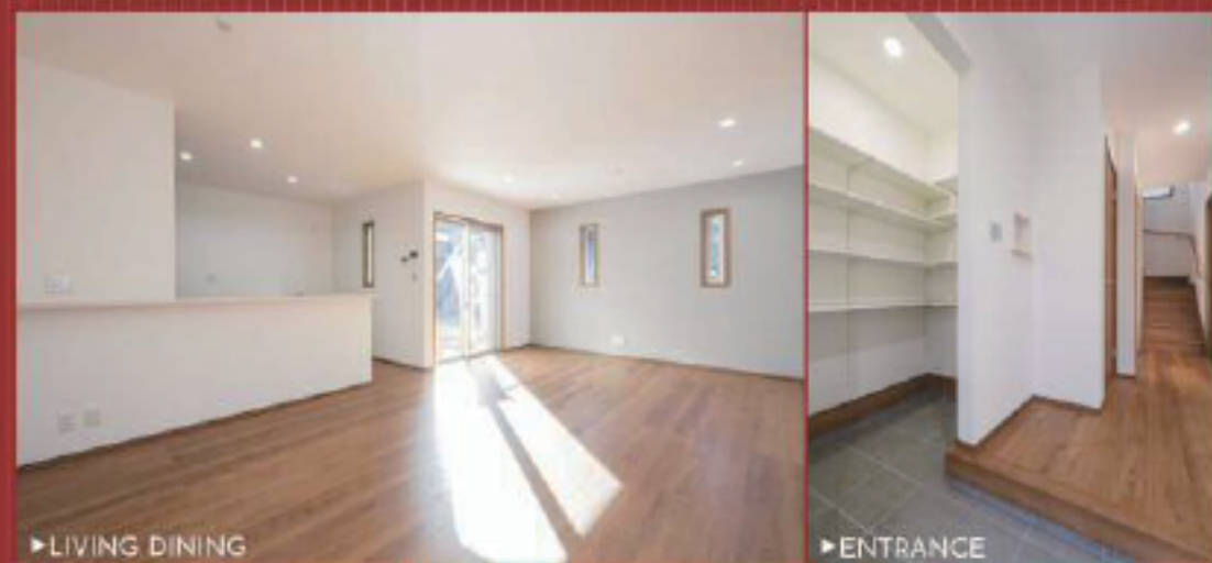
▶ LIVING DINING

□A邸1,290万円購入・借入900万の場合の返済例 □35年返済 □変動金利0.49% (銀行借入ローン) □返済期間返済 ※金利は最新実行利率が適用されます。詳しくは販売ホームページをご覧ください。※別途諸費用がかかります。