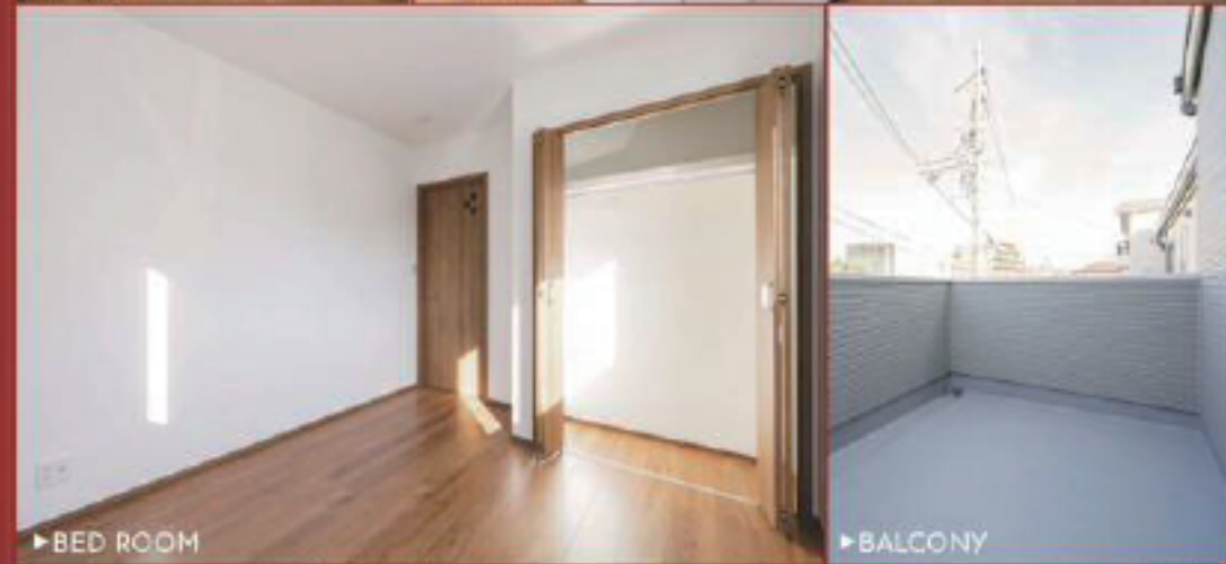
▶ BED ROOM